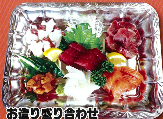
お造り盛り合わせ