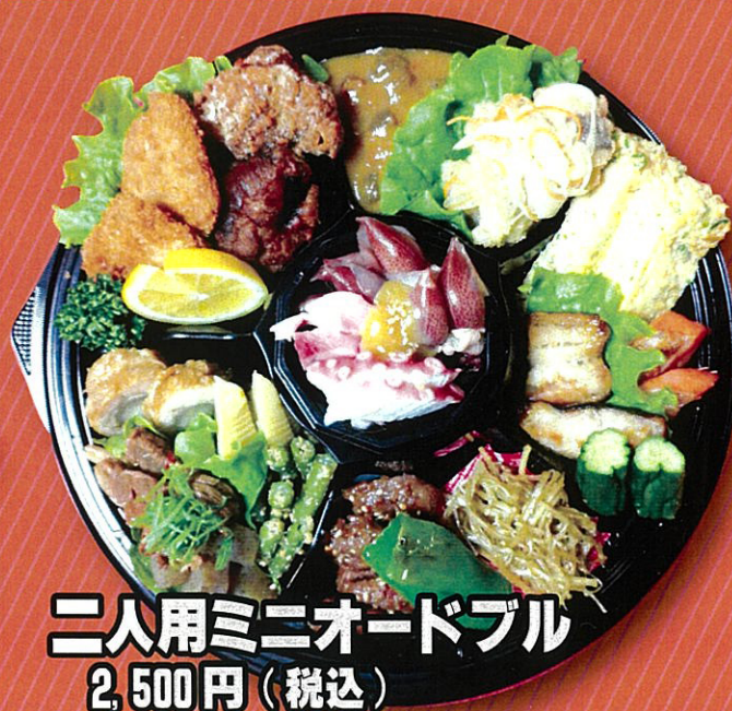
二人用ミニオードブル 2,500円(税込)